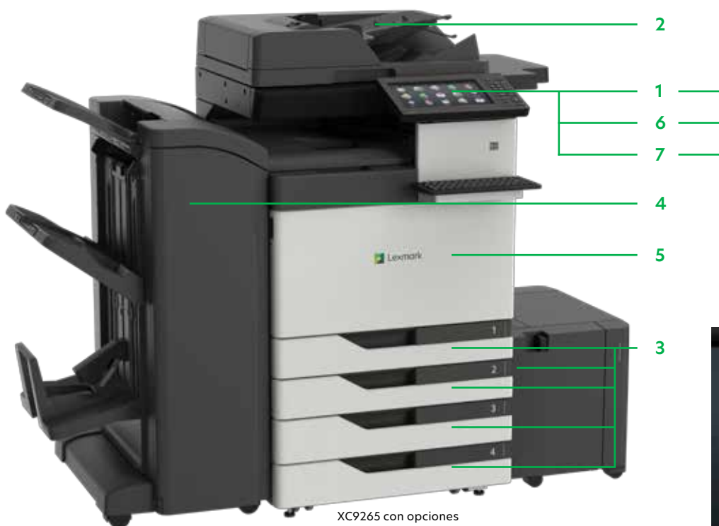
XC9265 con opciones

Imprima archivos de Microsoft Office, PDF y otros tipos de imágenes y documentos desde unidades flash, o seleccione e imprima documentos desde servidores de red o unidades en línea.